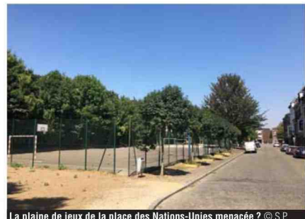
La plaine de jeux de la place des Nations-Unies menacée ?