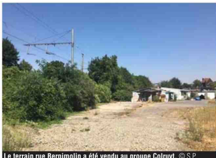
Le terrain rue Bernimolin a été vendu au groupe Colruyt.

tement peuplé. « Il existe un projet d'arrêt à Cornillon, au pied de la côte de Robermont. Ce serait parfait entre les Vennes et Bressoux. Mais là aussi, la Ville doit absolument anticiper. » Avec ces lignes 125A et 40, c'est tout le futur R.E.L. (Réseau Express Liégeois) qui se met tout doucement en place. Une sorte de « ring ferroviaire » autour de Liège qui demanderait un dernier ouvrage d'art à construire (entre Bressoux et Coronmeuse) pour fermer la boucle, comme le suggère depuis longtemps l'asbl Urbagora. Mais là, ça coûtera un peu plus cher... »