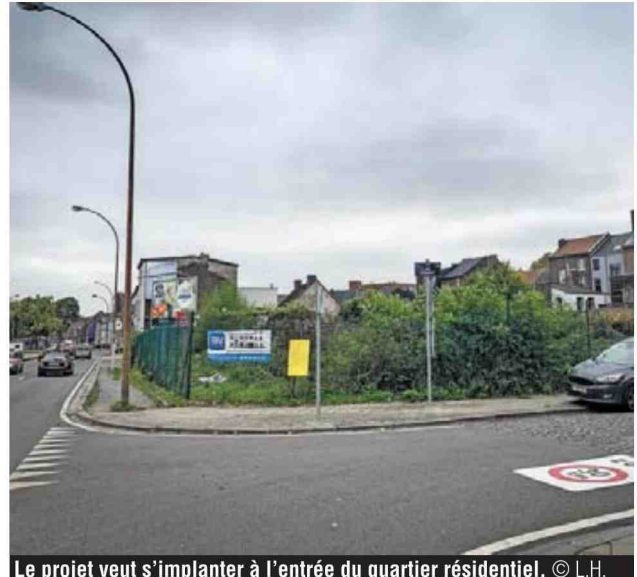
Le projet veut s'implanter à l'entrée du quartier résidentiel.