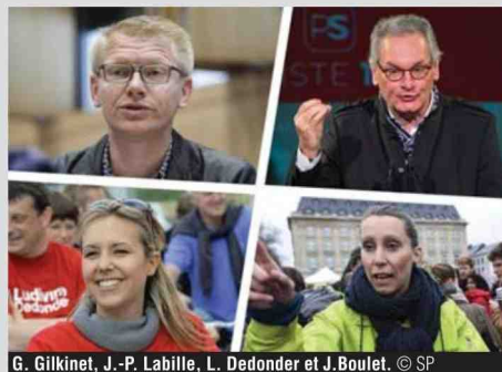
G. Gilkinet, J.-P. Labille, L. Dedonder et J. Boulet.