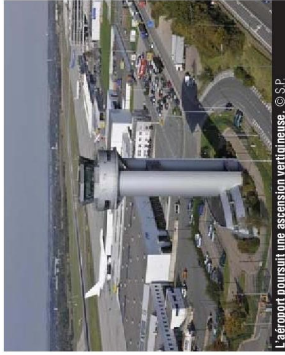
L'aéroport poursuit une ascension vertigineuse.

Autre point de vue de la part de Veronica Cremasco, la tête de liste Ecolo à la Région. « Chez Ecolo, nous avons une vision beaucoup plus nuancée sur le dossier. On ne peut pas poursuivre cette extension vertigineuse de l'aéroport sans une analyse critique fine. Qu'est-ce qui rentre dans cet aéroport et qu'est-ce qui en sort ? Combien d'emplois ont été créés et combien ont-ils coûté en termes d'investissements de la collectivité ? Sont-ils durables ou délocalisables ? Que se passera-t-il si les Chinois décident du jour au lendemain de partir ailleurs ? Et de même sur les conséquences écologiques de cette activité ? « Les nuisances par le bruit pour les riverains, mais pas seulement. Quelle est la production de CO 2 émise ? Quels dégâts sur l'environnement ? Etc... »